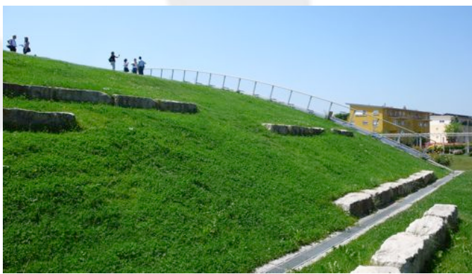
Sports hall Clara-Grunwald School, Friburgo (Germania).

Copertura verde di tipo intensivo calpestabile.