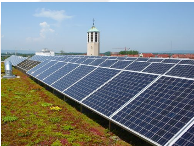
Institute for environmental Medicine, Friburgo (Germania), 2006.

Copertura verde di tipo intensivo calpestabile.