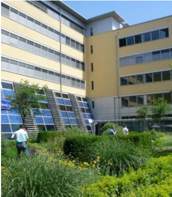
Solar Info center, Friburgo (Germania), 2003.

Esempi di coperture verdi realizzate nella città di Friburgo, città all'avanguardia per quanto concerne la diffusione di coperture verdi grazie anche ai programmi di supporto adottati negli ultimi anni.